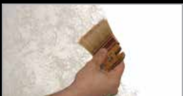
2 - Sabulador