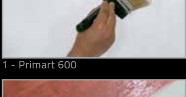
1 - Primart 600