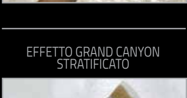
1 - Primart 600