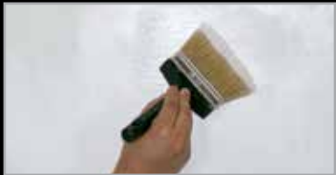
1 - Primart 600