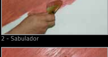
2 - Sabulador